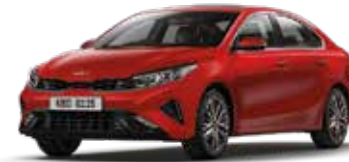
Runway Red (CR5)