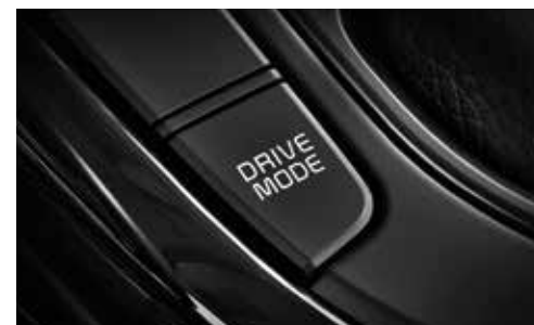
Modo de Conducción: ECO/NORMAL/SPORT