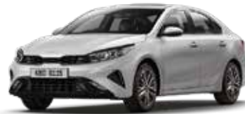
Silky Silver (4SS)