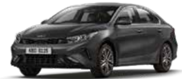
Platinum Graphite (ABT)