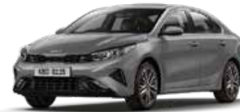
Steel Gray (KLG)