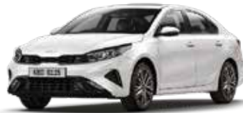
Snow White Pearl (SWP)