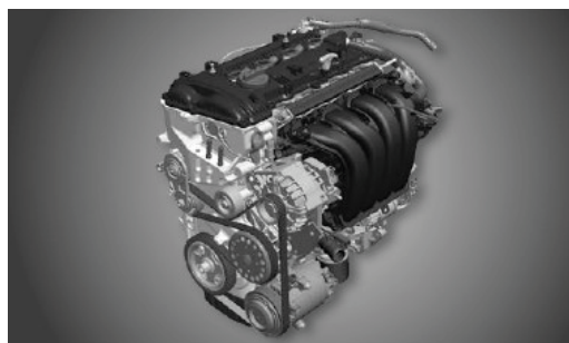
Motor: 2.0 / 152 cv / 154 NM