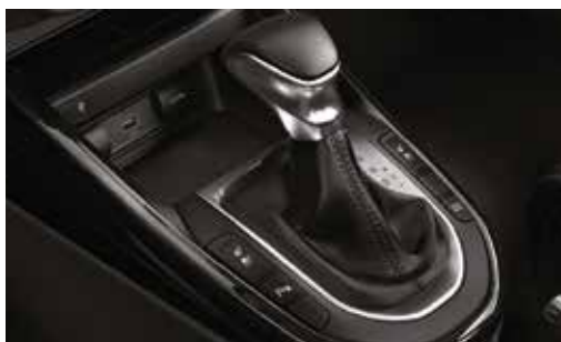
Caja: AT / 6 Vel