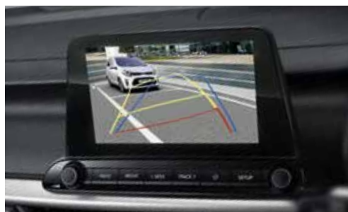
Camara de Retroceso con Sensores de Estacionamiento