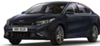
Gravity Blue (B4U)