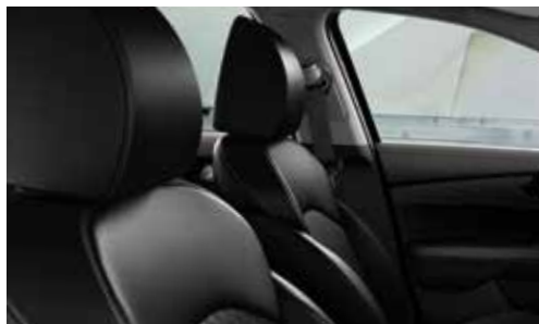
Tapizados en Cuero