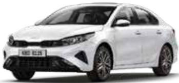
Clear White (UD)