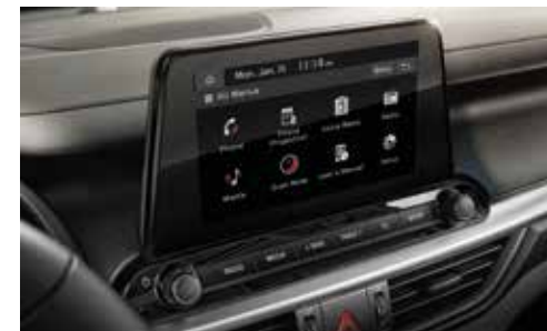
Central Multimedia 8" Inalámbrica con Android Auto/ Apple Car Play