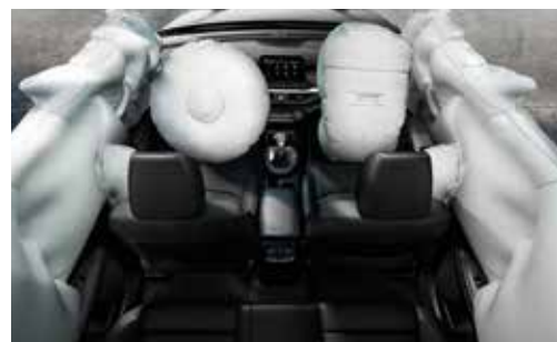
Seguridad: 6 Airbags / ABS- ESP - HAC