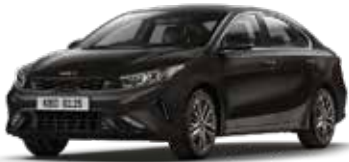
Aurora Black Pearl (ABP)