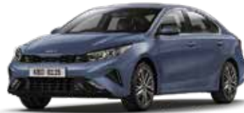
Horizon Blue (BBL)