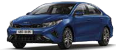
Mineral Blue (M4B)