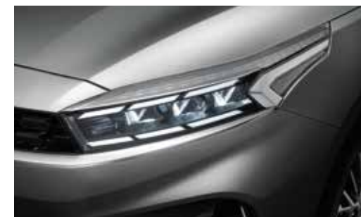
Faros delanteros: Faros full LED